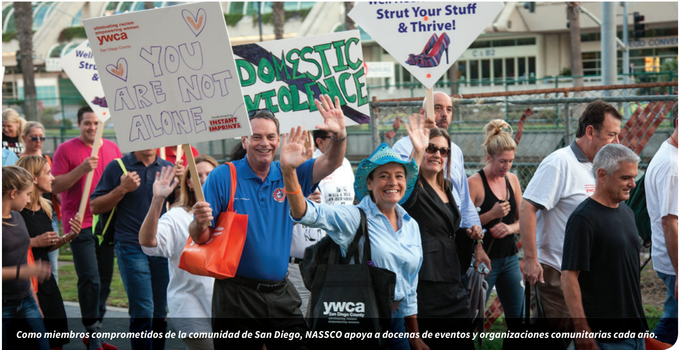
Como miembros comprometidos de la comunidad de San Diego, NASSCO apoya a docenas de eventos y organizaciones comunitarias cada año.

General Dynamics NASSCO ha formado parte de la comunidad de Barrio Logan desde 1944, cuando se mudó a sus instalaciones en 28th Street y Harbor Drive bajo el nombre National Iron Works. Con el tiempo, National Iron Works evolucionó hasta convertirse en General Dynamics NASSCO.