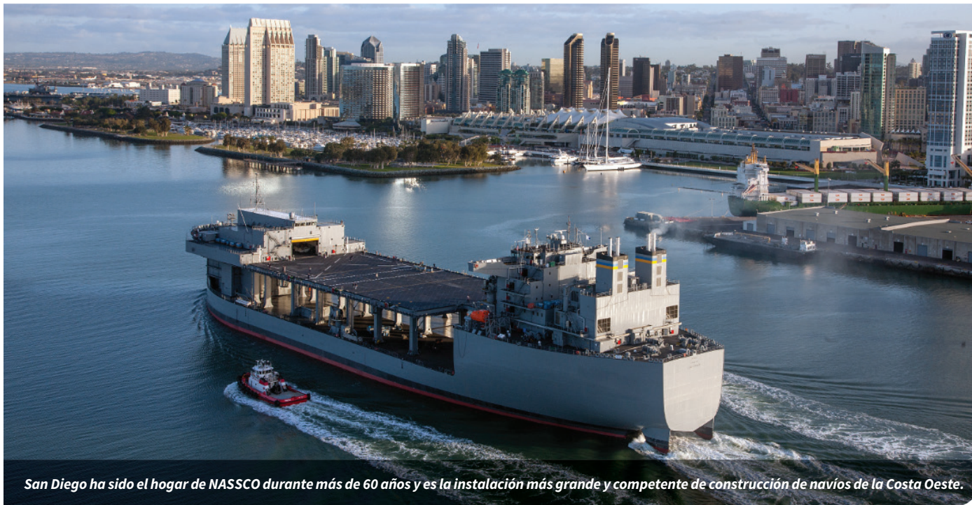
San Diego ha sido el hogar de NASSCO durante más de 60 años y es la instalación más grande y competente de construcción de navíos de la Costa Oeste.

General Dynamics NASSCO nació en el corazón industrial de San Diego, a lo largo de la dinámica línea costera, de la hermosa e histórica Bahía de San Diego. En 1905, un pequeño taller de fundición y taller de máquinas llamado California Iron Works abrió sus puertas en Seventh Avenue y Market Street en San Diego.